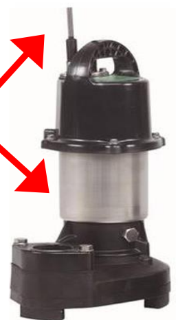
新明和工業 CRB (CRS) 321ES CRS401ES